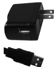
alimentation externe type USB (non fournie)

Un bloc d'alimentation à centre positif 9V, 500mA courant continu (vendu séparément) ou une alimentation de type USB (vendu aussi séparément) est requis pour l'utilisation autonome.